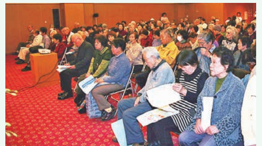
糖尿病生活習慣病教室委員会